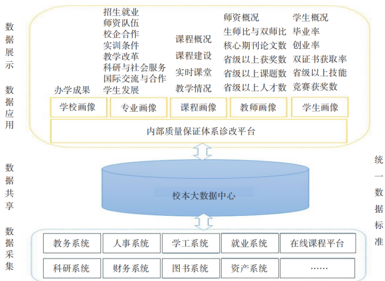
图2 内部质量保证体系诊改平台建设路径框架

其中,专业发展、课程管理、教师发展、学生发展4个系统根据相应标准及其质量控制点与核心指标的设置情况进行数据采集与诊改分析。其数据来源分为两部